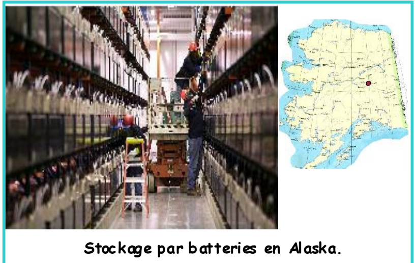
Stockage par batteries en Alaska.

Les nouvelles batteries Lithium-ion posent encore quelques problèmes et restent chères. Mais elles ont de très bonnes caractéristiques techniques, un excellent rendement et une forte rétention de charge constante dans le temps. Par ailleurs, elles sont étanches, légères et recyclables. Ce sont « les batteries du futur ».