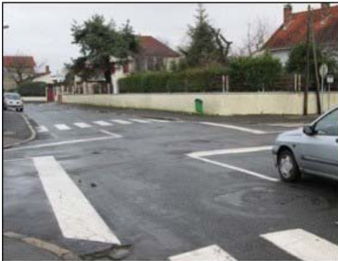
Quand Dieu a créé les STOP il en a créé suffisamment, et même un peu plus