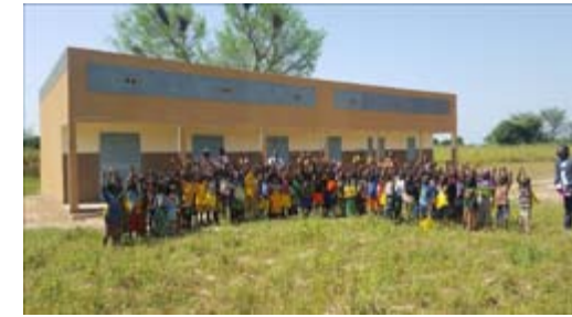
Les 2 salles de classe construites cette année pour la rentrée en octobre dernier.